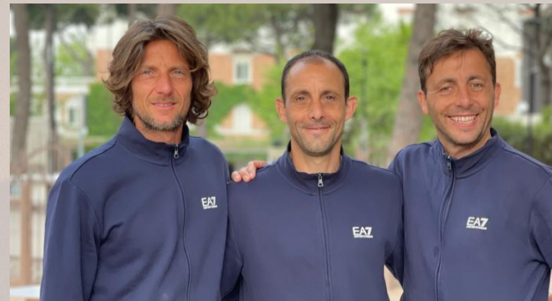
MarePineta Sporting Club

Sono tanti i fattori che rendono questo evento così straordinario e sarà nostra premura concentrarci su ogni singolo aspetto. Il nostro obiettivo è quello di rendere piacevole i momenti passati in campo e allo stesso tempo creare un'atmosfera cordiale e di condivisione al di fuori dei campi da gioco. Saremo disponibili per venire incontro a qualsiasi esigenza di voi giocatori e rendere l'esperienza di questo spettacolare torneo indimenticabile.