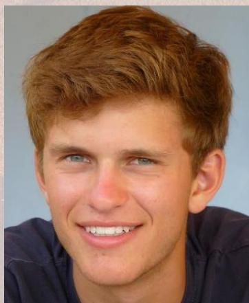
Nicolas Brand Welcome Desk

Siamo onorati di ospitare ancora una volta questa edizione dell'ITF World Tennis Masters Tour a Milano Marittima. Il MarePineta Sporting Club è pronto per accogliere tutti i giocatori e tutte le giocatrici sui nostri splendidi campi. Sarà nostra premura farvi trovare tutti i servizi necessari per poter competere al meglio delle vostre possibilità. Non vediamo l'ora di intraprendere questo viaggio insieme a tutti voi!